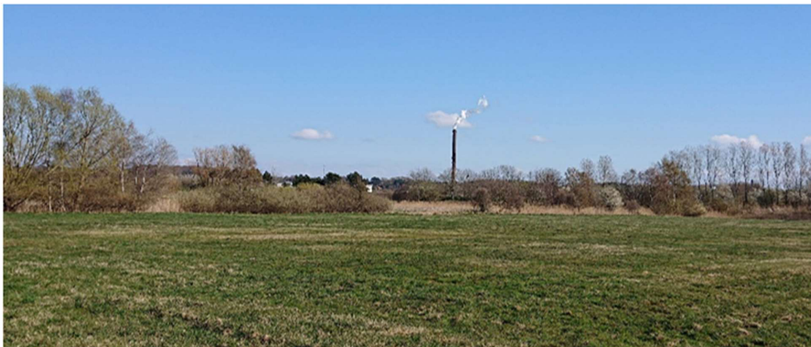
Set fra Hanehoved cirka ved enden af Strandlodsvej billede 4