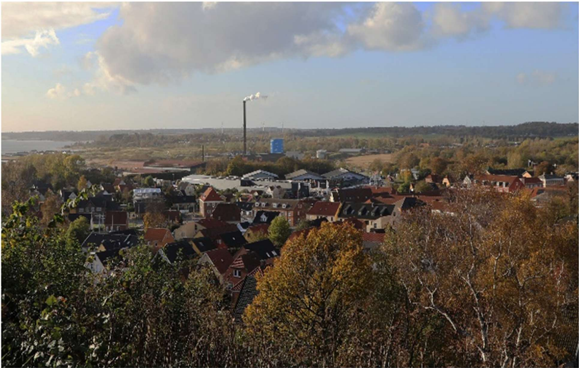
Set tættere på.