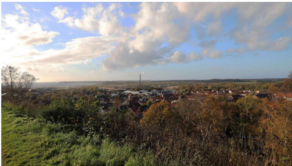
Set fra Tårnbakken billede 3